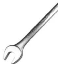
Chave Combinada Stan