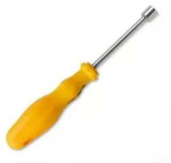
Chave Canhao Moretzsohn M- 4 x 125