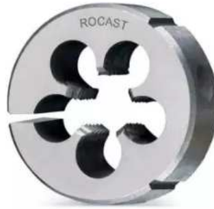
Cossinete - Rocast - BSW 1/2 x 12 FFP